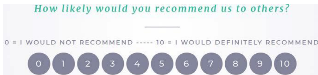
Obr. 3 Net Promoter Score hodnotí intenci uživatele doporučit službu ostatním, převzato z Juntumaa et al. (2020)

Vyšší skóre NPS naměřilo paralelní dotazování, kde byla otázka Jaká je pravděpodobnost, že byste nás doporučili ostatním? položena na prvním místě (průměrné skóre NPS 46.3), při základním dotazování bylo skóre mírně nižší (NPS 41.8). Nejvyšší skóre NPS bylo naměřeno v muzeích při základním dotazování (57.0). Tzv. smajlíková otázka Jak jsme si dnes vedli? získala vyšší průměrné hodnoty v základním dotazování (81.6), kdy byla otázka položena na prvním místě, zatímco při paralelním dotazování byly výsledky mírně nižší (77.3). Nejvyššího skóre bylo naměřeno opět v muzeích během základního dotazování (86.8). Otázka, která se v terminálu zobrazí jako první, zřejmě poutá vyšší pozornost respondentů a získává lepší hodnocení. Míru zodpovězení obou otázek mohla ovlivnit také grafická úprava – více odpovědí získala smajlíková otázka (5376), která byla znázorněna pomocí barevných smajlíků, paralelní otázka na doporučení služeb byla podbarvena šedě a zaznamenala menší odezvu (4009). Zda má pořadí otázek vliv na odpovědi, jejich počty a závislosti se bohužel nepodařilo objasnit a autoři navrhuji toto téma jako námět pro další studie.